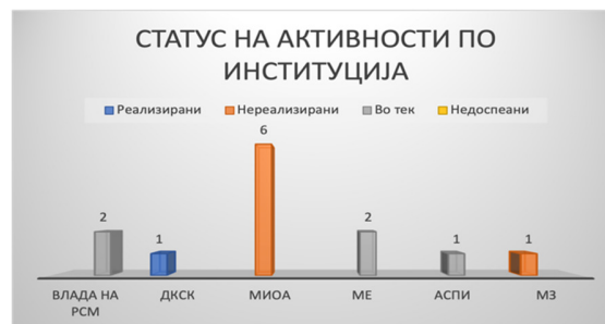
Слика 18: Вкупен статус на активности по институции