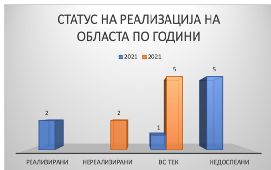
Слика 50: Статус на активности по евалуационен период

Од вкупно осум активности кои се предвидени во Стратегијата за секторот медиуми и граѓанско општество две активности не се реализирани (25%), една е реализирана (12,5%), а пет активности се во тек на реализација (62,5%). За 2022 година вкупно се предвидени пет активности при што две се со статус нереализирани, а три се во тек на реализација. Дополнително, две активности се пренесени од претходниот евалуационен период кои се во тек.