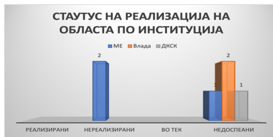
Слика 48: Вкупен статус на активности по институции