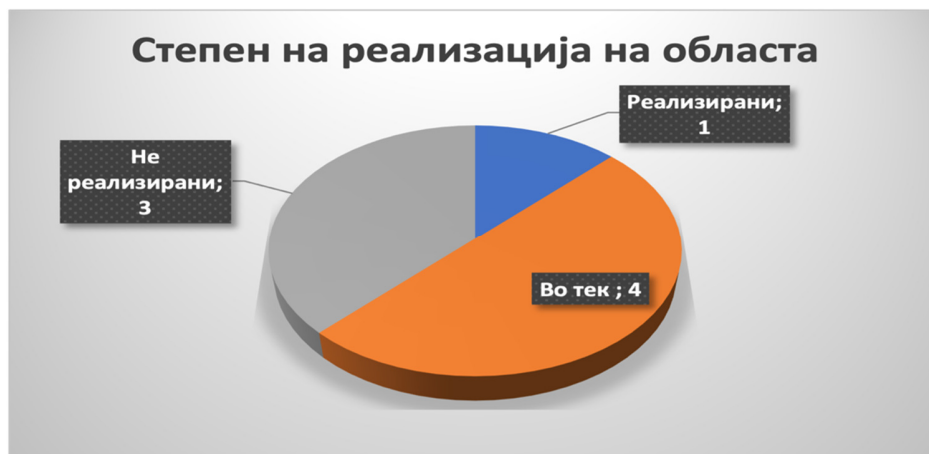
Слика 19: Вкупен степен на реализација во секторот

ДКСК изврши проверка и верификација на добиените податоци од надлежните институции и го утврди следниот статус на активностите во секторот политички систем: