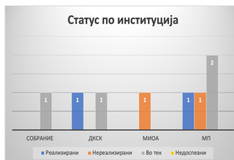
Слика 21: Вкупен статус на активности по институции