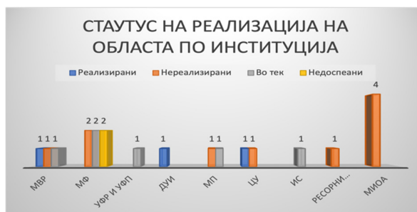
Слика 27: Вкупен статус на активности по институции