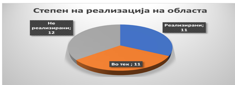
Слика 31: Вкупен степен на реализација во секторот

Од вкупно 34 активности кои се предвидени во Стратегијата за секторот образование, 11 активности се реализирани (32%) во 2021 и 2022 година, 11 активности се во тек (32%), а 12 активности не се реализирани, за кои рокот за реализација е поминат (36%). За 2022 година вкупно се предвидени осум активности од кои шест не се реализирани, а две се во тек. Дополнително, од претходниот извештаен период пренесени се 20 активности (од кои дел се континуирани), од кои пет се реализирани, шест се нереализирани, а девет се во тек.