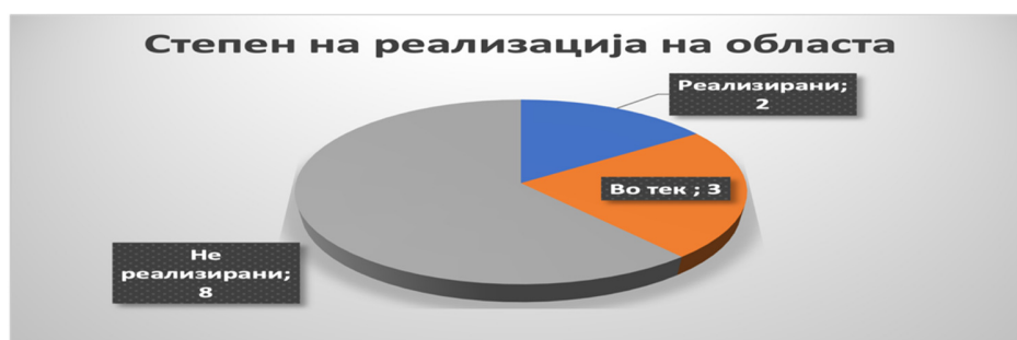
Слика 43: Вкупен степен на реализација во секторот

Од вкупно 13 активности кои се предвидени во Стратегијата за секторот економија и бизнис, две активности се реализирани (15%), осум активности не се реализирани (61%), а три активности се во тек (24%). За овој извештаен период предмет на евалуација се сите 13 активности.