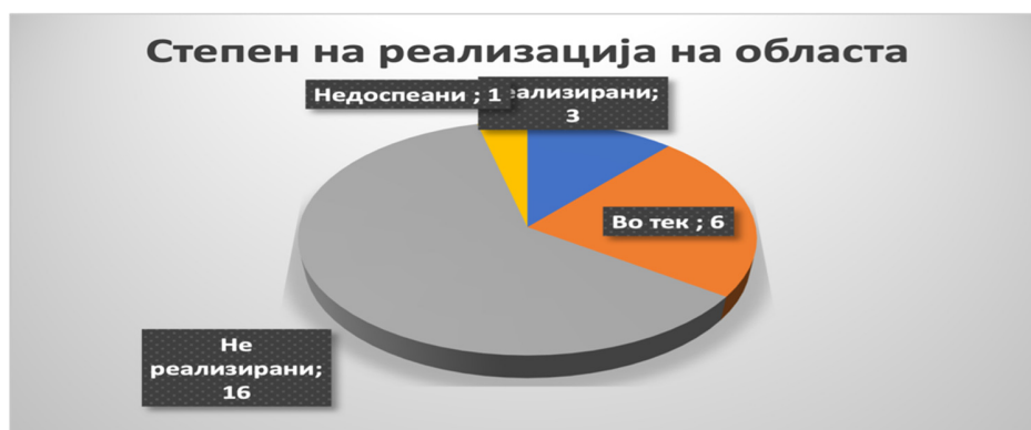
Слика 28: Вкупен степен на реализација во секторот

За Проблемот 5: Транспарентно и објективно одлучување во постапката за лекување во странство , предвидена е единствена Мерка 1: Утврдувањето на референтни болници преку јасно дефинирани критериуми во подзаконски акт е единствената мерка за надминување на овој проблем која ја опфаќа следната Активност 1.1: Измена на акти за дефинирање на критериумите . Рокот за активноста беше втора половина на 2021 година , а носител на истата е ФЗОРСМ . Активноста во 2021 година не беше реализирана, додека во 2022 година активноста е со статус „реализирана“ , бидејќи ФЗОСМ не извести дека донесен е нов Правилник за начинот на користење на здравствени услуги на осигурените лица во странство, изготвен е Акциски план за спроведување на постапката за склучување договори со странски болници, а изготвено е и Упатство за начин на работа и постапување на ЈЗУ Универзитетски клиници во Скопје во постапката за остварување на право на здравствени услуги на осигурените лица во странство и во постапката за изготвување на листи за избор на странски здравствени услуги.