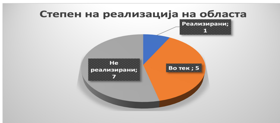
Слика 16 Вкупен степен на реализација на областа

Од вкупно 13 активности кои се предвидени во Стратегијата за оваа хоризонтална област, една активност е реализирана (7%), пет активности се во тек (38%), а седум активности не се реализирани, а рокот за реализација е помина (55%).