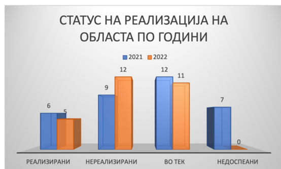
Слика 32: Статус на активности по евалуационен период