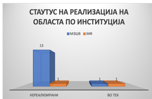
Слика 39: Вкупен статус на активности по институции