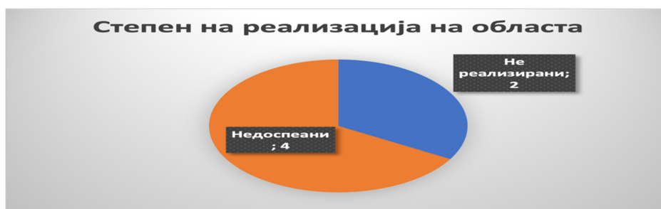
Слика 46: Вкупен степен на реализација во секторот

Од вкупно шест активности кои се предвидени во Стратегијата за секторот ЈП и АД во државна сопственост и сопственост на ЕЛС, две активности не се реализирани (33,3%), а четири активности не се досеани (66,7%). За 2022 година вкупно се предвидени две активности кои не се реализирани.