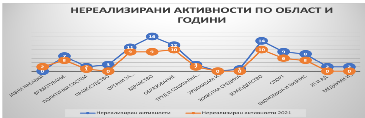
Слика 10: Графички приказ на бројот на нереализирани активности за 2021 и 2022 година по области/сектори

Компаративниот приказ на активностите во тек за 2021 и 2022 година по области/сектори е следен: