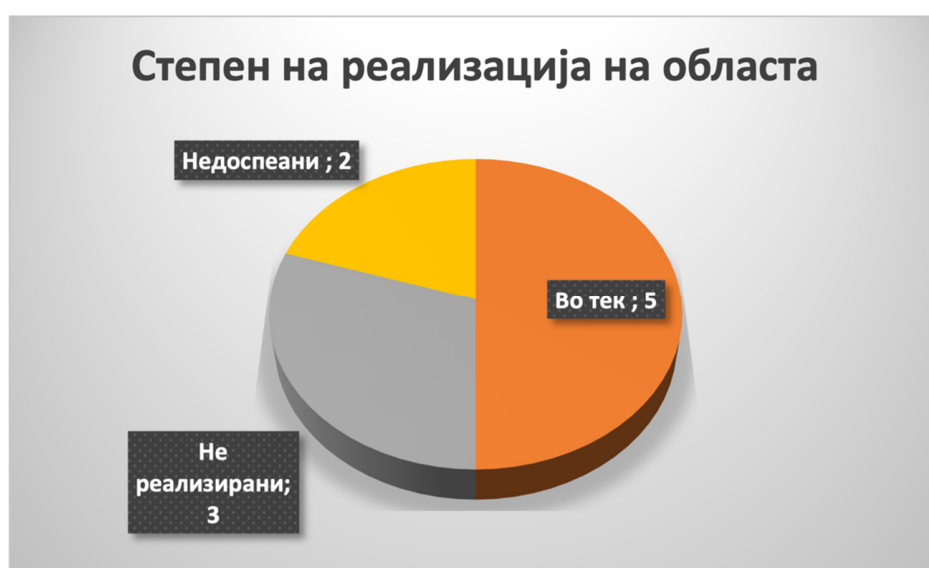
Слика 34: Вкупен степен на реализација во секторот

За Мерката 5: Зајакнување на надзорот во постапките за остварување на права по основ на помош и нега од друго лице, предвидена е Активност 5.1: Спроведување на редовни и на ад хок контроли (не само по основ на претставки), за која рокот за реализација е 2021 - континуирано, а истата е во надлежност на МТСП и е „во тек“ на реализација.