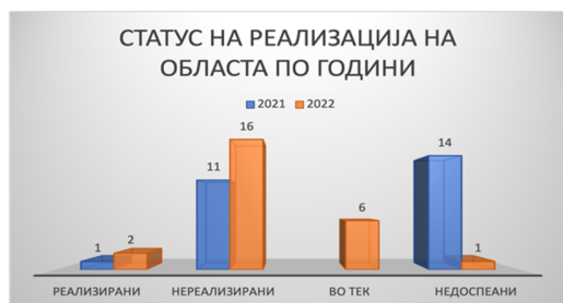
Слика 29: Статус на активности по евалуационен период

Од вкупно 26 активности кои се предвидени во Стратегијата за секторот здравство, три активности се реализирани (11%), шест активности се во тек (23%), а 17 активности не се реализирани, за кои рокот за реализација е поминат (66%). За 2022 година вкупно се предвидени 13 активности од кои само една активност е во тек, а 12 не се реализирани.