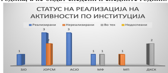
Слика 24: Вкупен статус на активности по институции