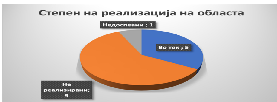
Слика 40: Вкупен степен на реализација во секторот

Мерката 2: Едукација за интегритет и етика на спортските федерации, клубови, администрација содржи три активности, Активност 2.1: Донесување на програма за обуки и едукација за интегритет и етика на спортските федерации, клубови, администрација и спортските работници , Активност 2.2: Спроведување на обуки, работилници, тркалезни маси, јавни медиумски настани за интегритет и етика и Активност 2.3: Изработка на пропаганден материјал за интегритет и етика во спортот . Рокот за првата активност беше прва половина на 2021 година , а втората и третата активност се континуирани . Надлежна институција е АМС, која во 2022 година има преземено дејствија за реализација на сите три активности, поради што статусот на сите е „во тек“.