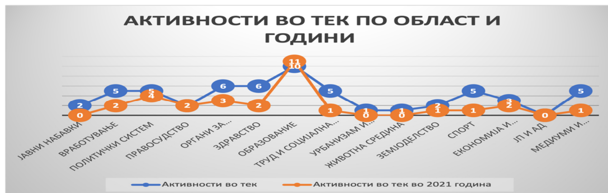
Слика 12: Табеларен приказ на бројот на активности во тек во 2021 и 2022 година по области/сектори

Графичкиот компаративен приказ на активностите во тек за 2021 и 2022 година по области/сектори е следен: