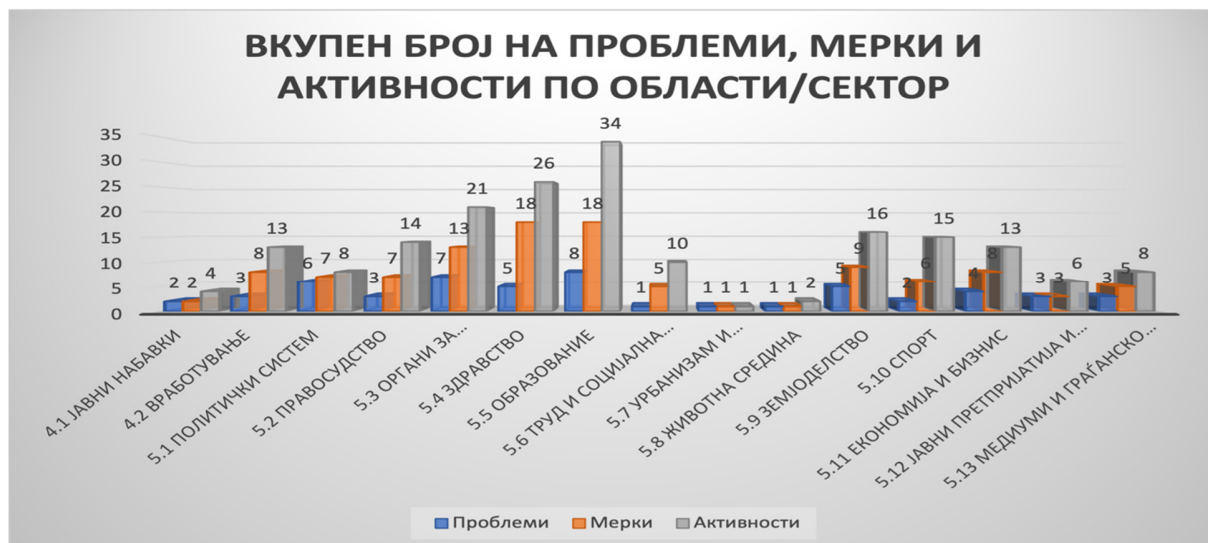
Слика 2: Број на проблеми, мерки и активности по области/сектори

Околу 40% од сите мерки и активности се однесуваат на секторите образование, здравство и органи за спроведување на законот.