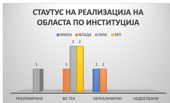
Слика 51: Вкупен статус на активности по институции