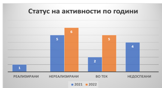
Слика 17: Статус на активности по евалуационен период

Од вкупно 13 активности кои се предвидени во Стратегијата за оваа хоризонтална област, една активност е реализирана (7%), пет активности се во тек (38%), а седум активности не се реализирани, а рокот за реализација е помина (55%).