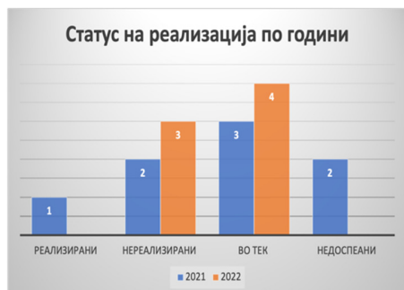
Слика 20: Статус на активности по евалуационен период

Од вкупно осум активности кои се предвидени во Стратегијата за секторот политички систем, една активност е реализирана (12,5%), пет активности се во тек (62,5%), а две активности не се реализирани, а рокот за реализација е поминат (25%). За 2022 година вкупно се предвидени две активности кои се во тек. Дополнително од 2021 година се пренесени пет активности, од кои две не се реализирани, а три се во тек. Една активност беше реализирана во 2021 година.