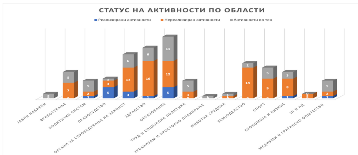
Слика 7: Графички приказ на бројот на реализирани, нереализирани и активности во тек во 2022 година по области/сектори

Графичкиот приказ на статусот на активности по области е следен: