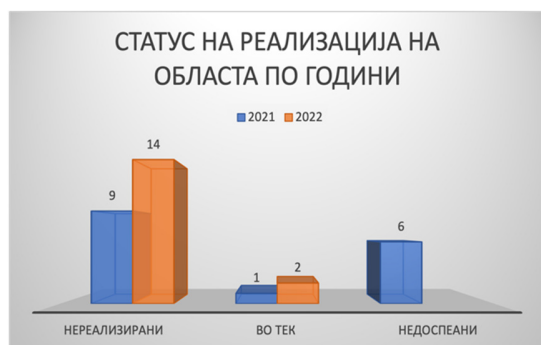
Слика 38: Статус на активности по евалуационен период

Од вкупно 16 активности кои се предвидени во Стратегијата за секторот земјоделство, 14 активности не се реализирани (87%), а само две активности се во тек (13%). 11 активности се со рок на реализација во 2021 година, а пет активности во 2022 година. Нема ниту една реализирана активност. Имајќи во предвид дека во 2021 година ниту една активност не е реализирана, сите активности се предмет на евалуација и во овој извештаен период, а нивните статуси се прикажани погоре.