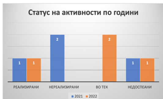
Слика 14: Статус на активности по евалуационен период

Од вкупно четирите активности кои се предвидени во Стратегијата за оваа хоризонтална област, една активност е реализирана (25%), две активности се во тек (50%), а една активност сеуште не е доспеана (25%).