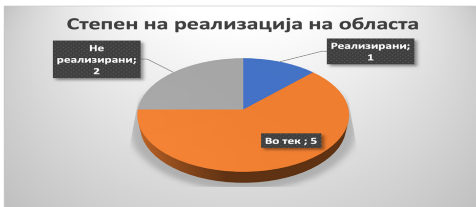
Слика 49: Вкупен степен на реализација во секторот

насока на пропишување обврска за воспоставување единствена база на податоци со информации за доделените средства и ефектите од проектите за сите граѓанските организации кои добиваат средства од јавни институции и ЕЛС и Активност 1.2: Изменување и дополнување на Законот за здруженија и фондации во насока на пропишување обврска јавни институции и ЕЛС за редовно ажурирање на единствена база на податоци. Рокот за реализација на двете активности беше прва половина на 2022 година , при што од добиените извештаи произлегува дека и двете активности се во надлежност на МП и двете активности се со статус „во тек“ на реализација.