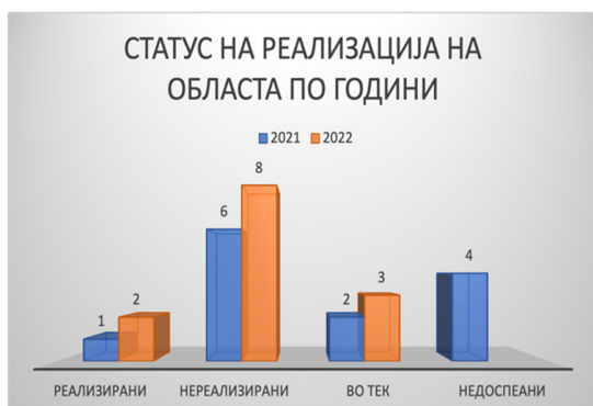
Слика 44: Статус на активности по евалуационен период

Од вкупно 13 активности кои се предвидени во Стратегијата за секторот економија и бизнис, две активности се реализирани (15%), осум активности не се реализирани (61%), а три активности се во тек (24%). За овој извештаен период предмет на евалуација се сите 13 активности.