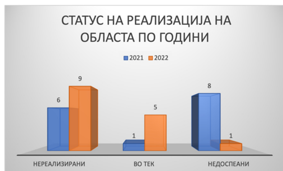
Слика 41: Статус на активности по евалуационен период

Од вкупно 15 активности кои се предвидени во Стратегијата за секторот спор, девет активности не се реализирани (60%), пет активности се во тек (33%), а една активност не е доспееана (7%). Нема ниту една целосно реализирана активност. За 2022 година вкупно се предвидени седум активности при што сите се со статус не реализирани. Дополнително има четири континуирани активности, од кои две се во тек а две не се реализирани.