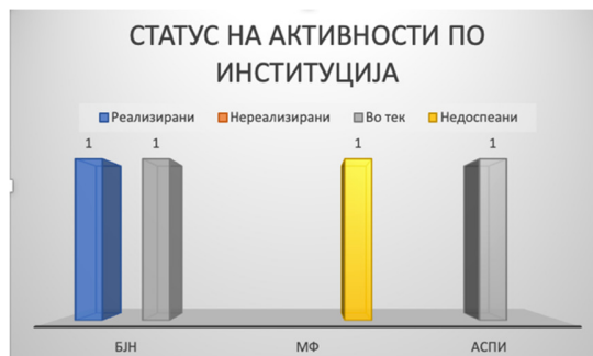
Слика 15: Вкупен статус на активности по институции