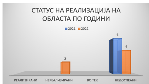
Слика 47: Статус на активности по евалуационен период