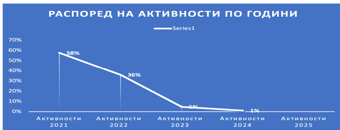
Слика 3: Процентуален распоред на активности по години

Распоредот на Активности по години е следен: