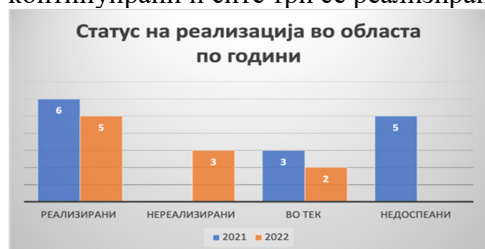
Слика23: Статус на активности по евалуационен период

Од вкупно 14 активности кои се предвидени во Стратегијата за секторот правосудство, девет активности се реализирани (64%), две активности се во тек (14%), а три активности не се реализирани (22%). За 2022 година вкупно се предвидени пет активности од кои три не се реализирани, една е реализирана и една е во тек. Дополнително има три активности кои се континуирани и сите три се реализирани за 2022 година, а ќе бидат следени и следните години.