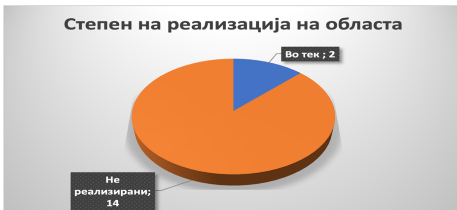
Слика 37: Вкупен степен на реализација во секторот

здравство; Закон за ветеринарно здравство, Закон за ветеринарно медицински производи, Закон за нус производи од животинско потекло, Закон за идентификација и регистрација на животни и Активност 1.2: Формирање на посебен орган за инспекциската служба за ветеринарно здравство од органот кој спроведува имплементација на политиките во ветеринарно здравство во посебен инспекторат или преземање на инспекторите во Државен инспекторат за земјоделство. Рокот за двете активности е втора половина на 2021 година , а носител е МЗШВ . Двете активности се „ нереализирани “ и во 2021 година и во 2022 година.