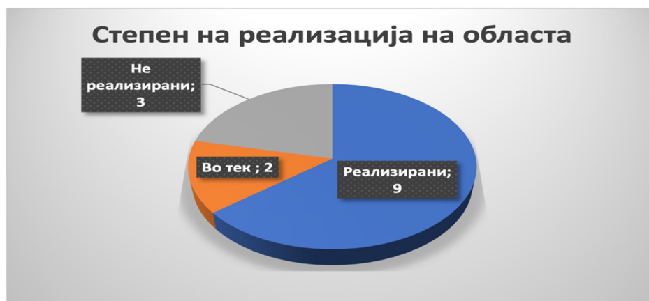
Слика 22: Вкупен степен на реализација во секторот

ДКСК изврши проверка и верификација на добиените податоци од надлежните институции и го утврди следниот статус на активностите во во секторот правосудство: