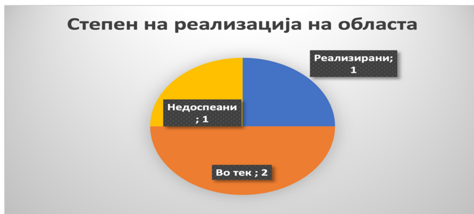
Слика 13: Вкупен степен на реализација на областа

Врз основа на добиените податоци од надлежните институции и проверка и верификација на истите од страна на ДКСК, вкупниот степен на реализација на активностите од донесувањето на Стратегијата до денес во областа јавни набавки е следен: