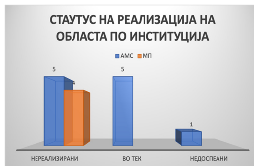
Слика 42: Статус на активности по институција