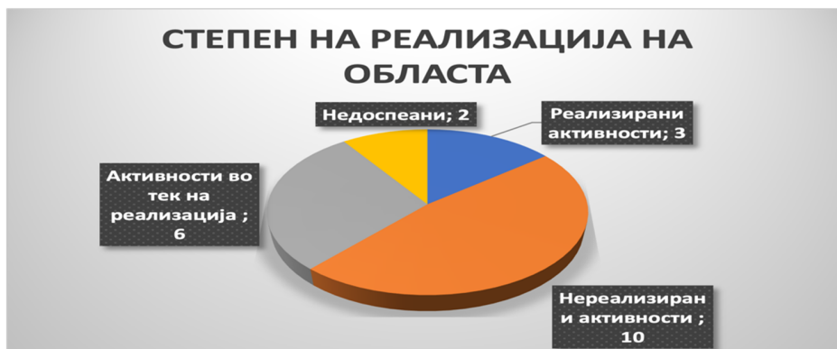
Слика 25: Вкупен степен на реализација во секторот

Од вкупно 21 активност предвидена во Стратегијата за секторот органи за спроведување на законот, три активности се реализирани (14%), шест активности се во тек (28%), 10 активности не се реализирани (48%) и две активности не се доспеани (10%).