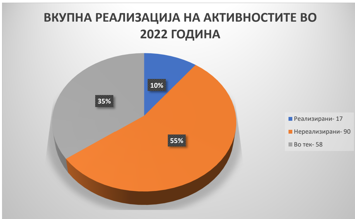
Слика 6: Графички приказ на бројот и процентот на реализирани, нереализирани и активности во тек во 2022 година

Од графичкиот приказ може да се види дека најголем е процентот на нереализирани активности - 55%, активностите во тек опфаќаат 35%, а делот на целосно реализирани активности е многу мал и изнесува само 10% .