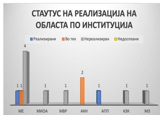
Слика 45: Вкупен статус на активности по институции