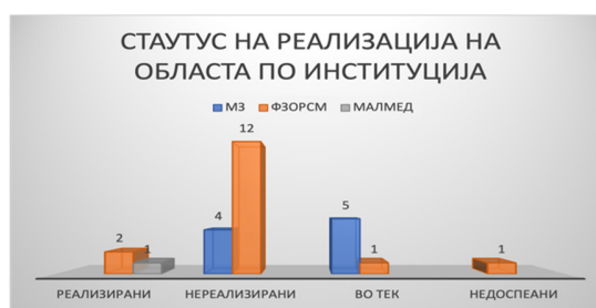
Слика 30: Вкупен статус на активности по институции