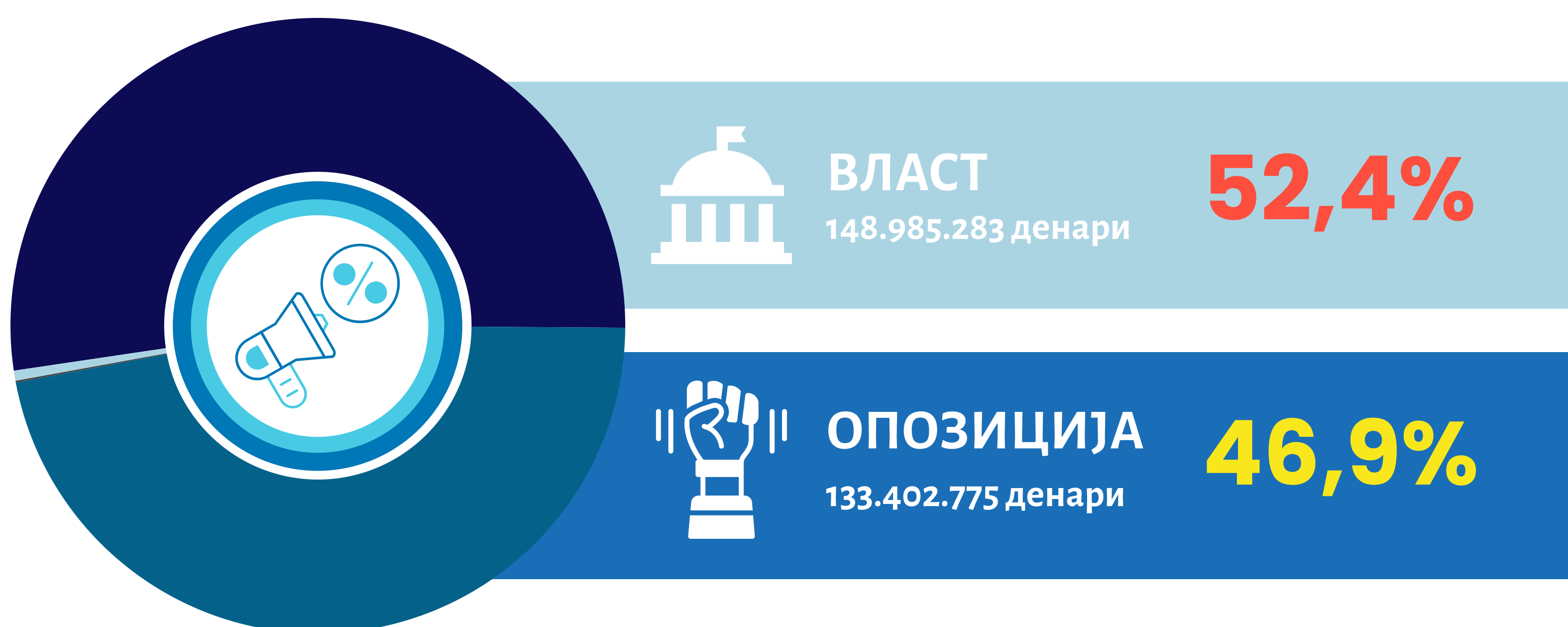
Графикон 4 Приходи за ППР по позиција на учесник