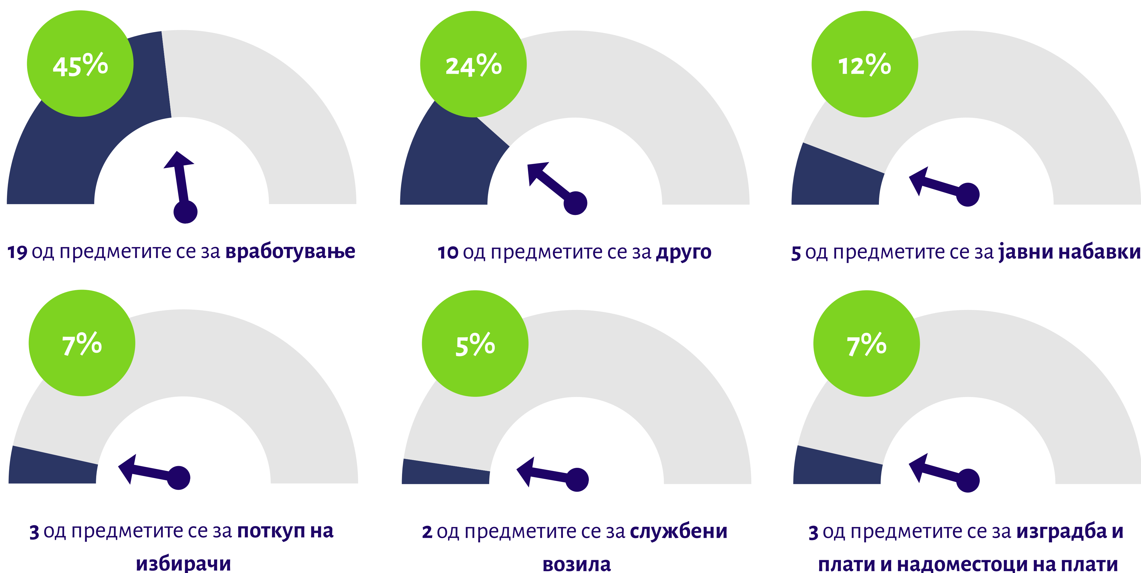
Графикон 7 Број на добиени предмети по основ

Во периодот на изборниот процес ДКСК оформи вкупно 43 (четириесет и три) предмети коишто се резултат на пријави за сомневање за сторени повреди на Изборниот законик и Законот за спречување на корупцијата и судирот на интереси и предмети оформени по сопствена иницијатива на Комисијата.