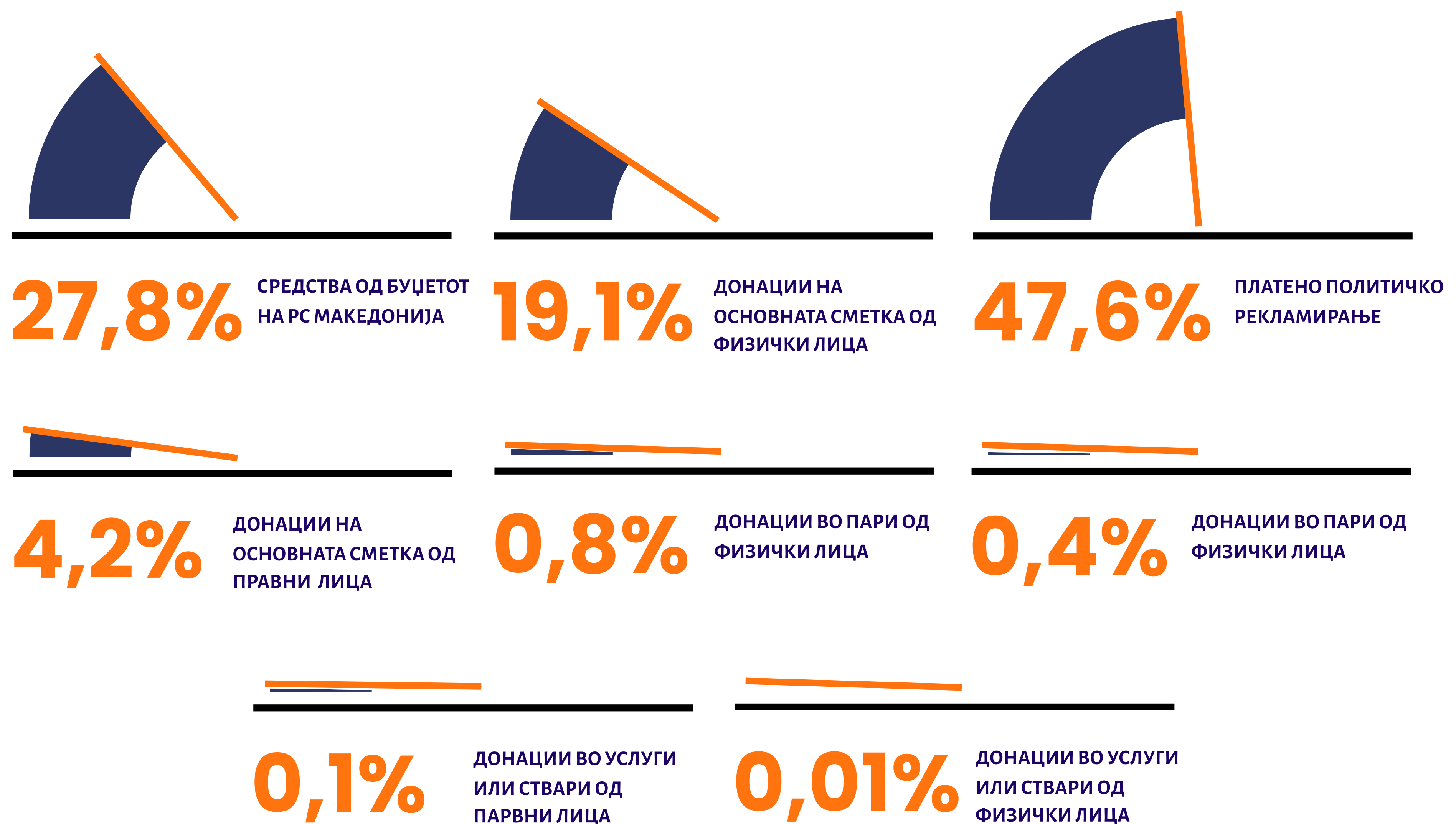
Графикон 3 Вкупен износ на приходи по поттип на извор