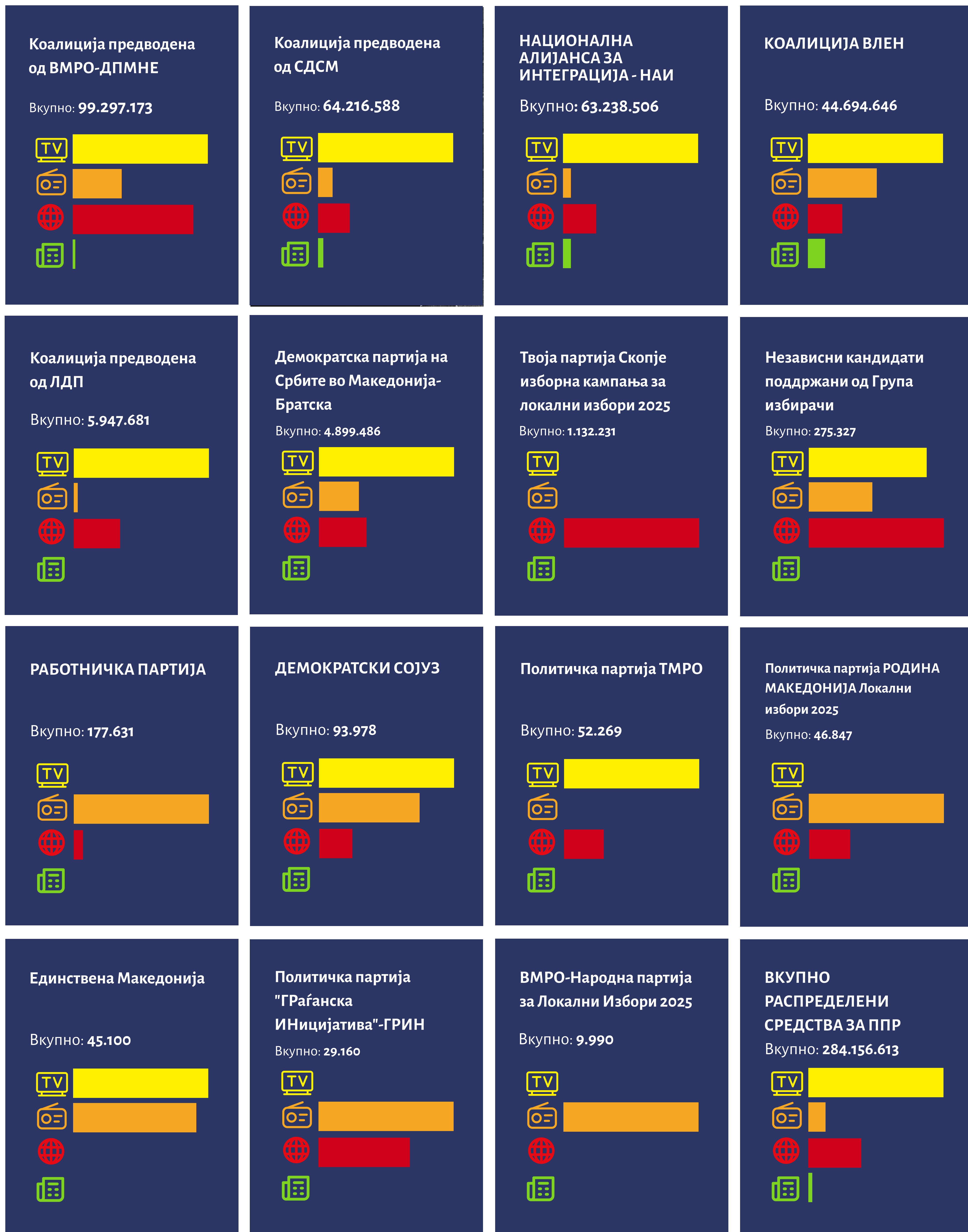
Графикон 4 Приходи за ППР по позиција на учесник