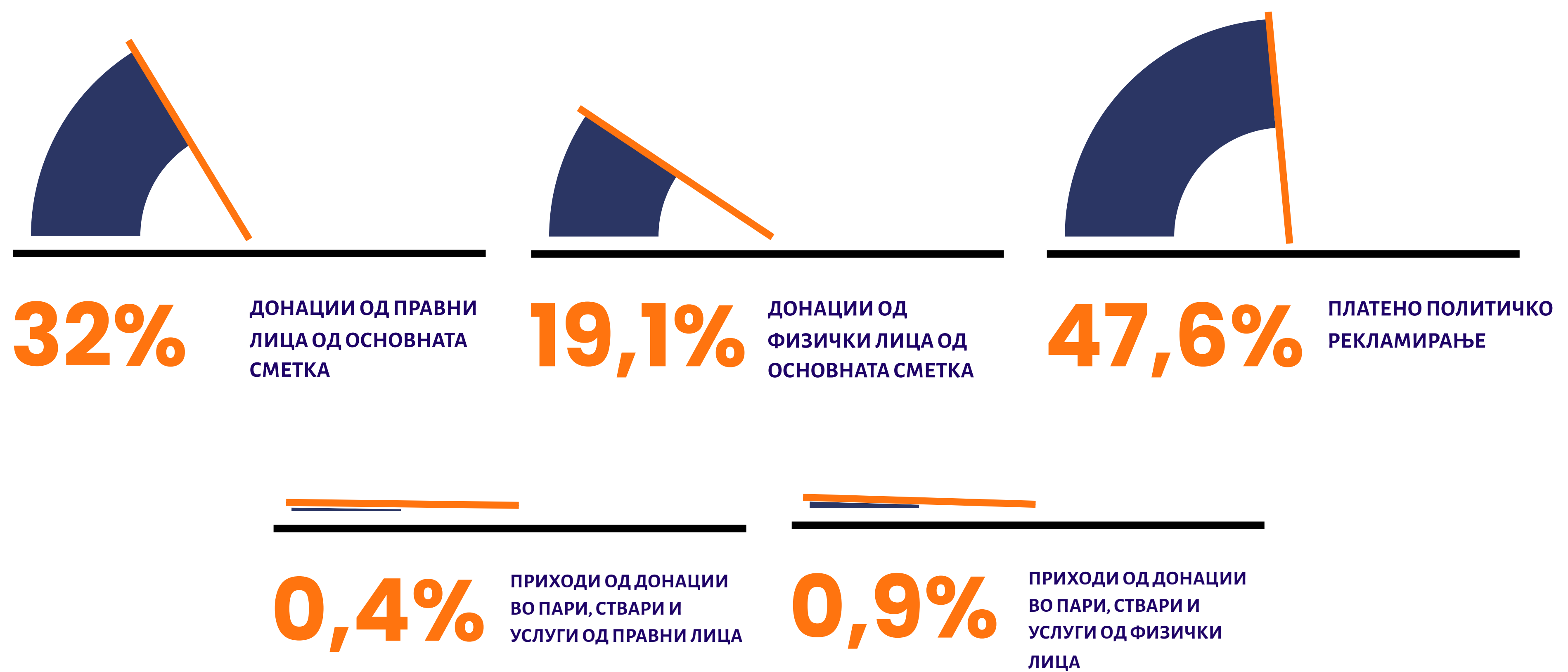
Графикон 2 Вкупен износ на приходи по извор