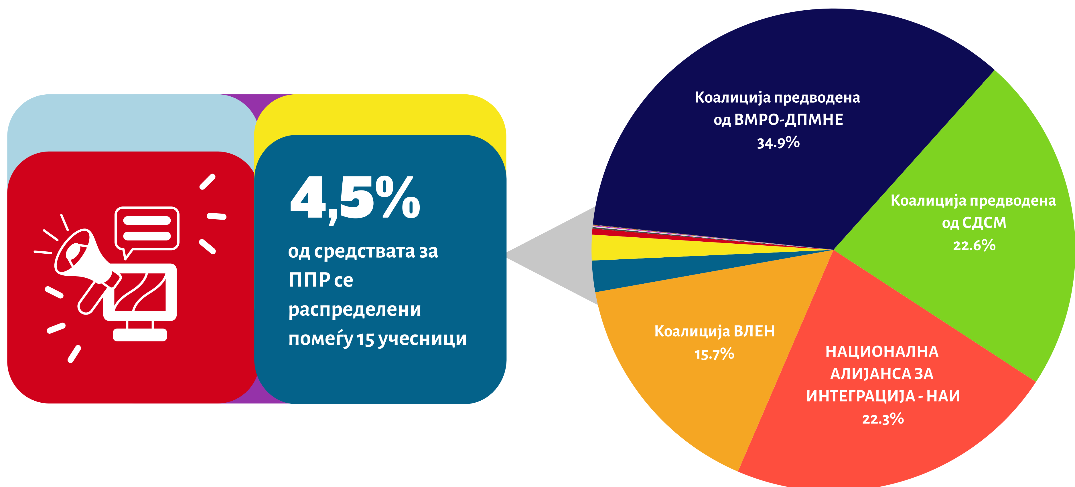
Графикон 4 Приходи за ППР по позиција на учесник